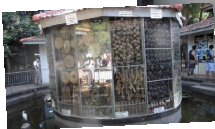
←吉久 camera アキラの地雷博物館 今でもカンボジアにはたくさん地雷が埋まっています

日本のように四季はなく年間を通して25℃~35℃と、とても暑い国なんです! 公用語はクメール語、通貨はリエルですが、米ドルが流通しているので米ドルで買い物することが出来ます。1$=4000リエルで、私がホームステイした村では350m 2 の缶ジュースが2500リエルで売っていました!日本円で70円ぐらいなので日本の6割程度の値段になります。日本語ガイドの話では、公務員の月収が20,000円程度なので、物価は高いと感じました。