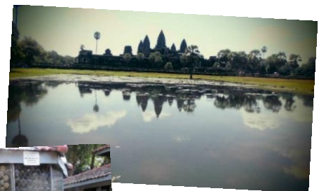
吉久 camera → 有名なアンコールワット蓮の花咲く素敵な鏡池

日本のように四季はなく年間を通して25℃~35℃と、とても暑い国なんです! 公用語はクメール語、通貨はリエルですが、米ドルが流通しているので米ドルで買い物することが出来ます。1$=4000リエルで、私がホームステイした村では350m 2 の缶ジュースが2500リエルで売っていました!日本円で70円ぐらいなので日本の6割程度の値段になります。日本語ガイドの話では、公務員の月収が20,000円程度なので、物価は高いと感じました。